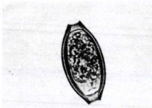
Figura 5. Huevecillo ovalado, característico del tricocéfalo Trichuris trichiura ; cada hembra produce de 3000 a 7000 huevos/día, que miden de 50 a 54 micras de largo, con tapones polares en ambas extremidades.

clara, que abundan en los meses de agosto a octubre cuando la transmisión palúdica es más intensa. La población rural vive muy dispersa, pobre y analfabeta en su mayoría y por razones laborales migra cíclicamente hacia las fincas cafetaleras, facilitando la transferencia del parásito hacia otras localidades no-infectadas. 8,19 La endemia chagásica se explica porque las habitaciones insalubres son favorables al desarrollo intradomiciliario de los triatomíneos hematófagos Rhodnius prolixus , Triatoma phyllosoma y Triatoma dimidiata maculipennis infectados