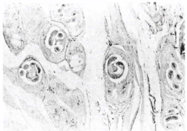
Figura 1. Biopsia muscular deltoidea de un niño de 8 años, con síndrome febril, mialgias intensas y eosinofilia de 30%; se observan las larvas parcialmente encapsuladas de la Trichinella spirallis .

La toxoplasmosis, triquinosis y teniasis-cisticercosis son zoonosis parasitarias; las dos últimas se perpetúan por la costumbre de alimentar a los cerdos con excremento humano o con desperdicios conteniendo Trichinella spirallis vivas presentes en los cuerpos de ratas muertas o carne con larvas enquistadas; en México, los humanos se infectan al comer "carnitas" de cerdo mal cocidas, chorizos, embutidos, jamón, hamburguesas adulteradas, salchichas y otros productos industrializados de porcinos; los reservorios de la triquinosis son además del cerdo, las ratas, perros, gatos, zorros, lobos, jabalíes, osos, felinos silvestres, mamíferos marinos del Ártico y otros carnívoros 4 (Fig. 1).