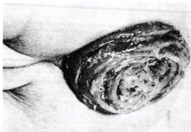
Figura 4. Caso de tricuriasis masiva y prolapso rectal, por Trichuris trichiura en un escolar de 9 años de Ometepec, Guerrero.

En la región tropical de Ometepec, Guerrero, localidad insalubre situada en la "costa chica" de la mixteca baja, con temperatura media anual de 22.3 C° y precipitación pluvial anual de 1,605 mm, predominaron los casos de poliparasitación, frecuentemente masiva, causada principalmente por el A. lumbricoides , T. trichiura (Fig. 4 y 5), Necator americanus y en grado menor Strongyloides stercoralis . 15-17 En esa misma región y en la faja costera comprendida entre Acapulco, Guerrero y Salina Cruz, Oaxaca, son extremadamente prevalentes el paludismo y la tripanosomiasis americana de Chagas; la persistencia endémica de la malaria se explica por la presencia de habitaciones con paredes