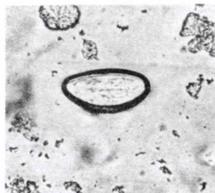
Figura 3. Los huevecillos del Enterobius vermicularis , encontrados en la piel perianal, miden de 50 a 60 micras de largo por 20 a 30 de ancho, siendo aplanados por un solo lado, recubiertos por una cáscara translúcida gruesa.